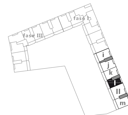
planta 7ª y bajocubierta